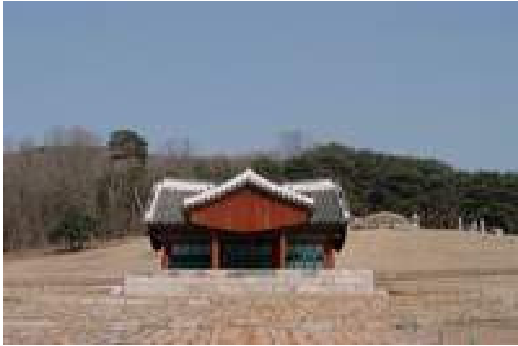
사도세자(경조)와 혜경궁 홍씨(헌경왕후)를 합장한 용릉(경기도 화성군 태안읍 소재) 사도세자의 죽음은 노론·소론 당쟁의 희생물로 보는 시각이 있지만, 죽음 직전 3 개월에 걸친 평양행의 목적이 분명해져야 뒤주에 갇혀 죽은 이유가 밝혀질 것이다.

을 즐겨 읽곤 하였다. 부왕의 강한 성격에 놀려 지내서인지 소심한 측면이 있었지만, 그래도 우스갯소리를 곧잘 한 것으로 전해진다.